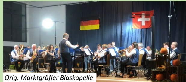
Orig. Marktgräfler Blaskapelle

Am Samstag stand in der voll besetzten Allemannenhalle in Eschbach ein Doppelkonzert mit der Original Marktgräfler Blaskapelle an. Der Anlass wurde vom Musikverein Eschbach organisiert. Der Anlass war zugleich der 150. Auftritt der Blaskapelle Thurgados.