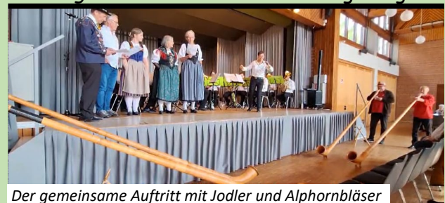
Der gemeinsame Auftritt mit Jodler und Alhornbläser

Am Sonntag Vormittag spielten die Ostschweizer Musikantinnen und Musikanten zum Kurkonzert in Bad Bellingen auf. Der Anlass wurde von einem Quartett des Jodelclubs Seerose Flüelen sowie einer Alhorngruppe aus dem Marktgräflerland umrahmt. Gemeinsam wurde das Lied Schwingerlüüt im Schwizerland vorgetragen.